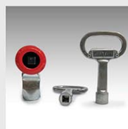
Advanced Locking System