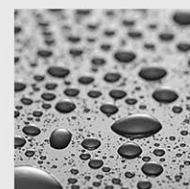
Condensation Protection (≤ IP 54)