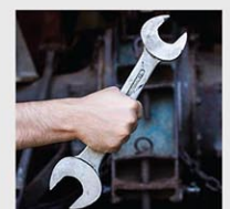
Best Service to Customer